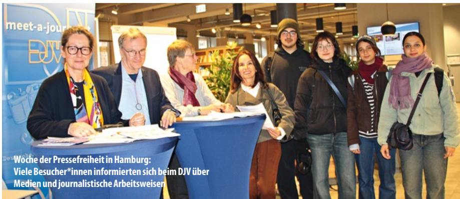
Woche der Pressefreiheit in Hamburg: Viele Besucher*innen informierten sich beim DJV über Medien und journalistische Arbeitsweisen