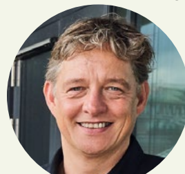
MARKUS BRAUCK