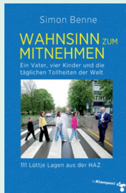
Wahnsinn zum Mitnehmen. Ein Vater, vier Kinder und die täglichen Tollheiten der Welt. 111 Lüttje Lagen aus der HAZ von Simon Benne, zu Klampen Verlag, 128 Seiten, 14 Euro