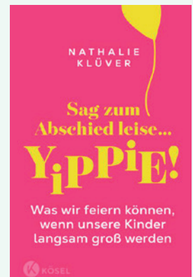
Sag zum Abschied leise... Yippie! von Natalie Klüver Kösel Verlag, 160 Seiten, 18 Euro