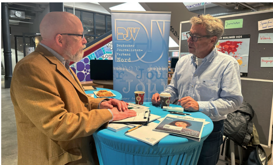
Bereits im vorigen Jahr (s.a. Foto rechts oben) war der DJV Nord auf der Hamburger Woche der Pressefreiheit präsent

Der DJV Nord beteiligt sich mit drei Formaten: Neben einer Fachdiskussion zu Nachrichtenauswahl und -nutzung am 4. November und einem Panel für die breite Öffentlichkeit zu Journalismus, Influencing