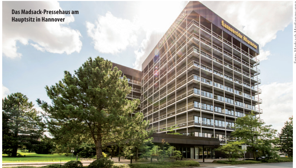
Das Madsack-Presserhaus am Hauptsitz in Hannover