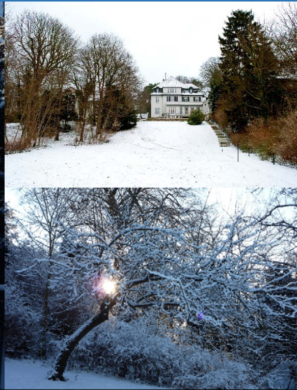
Winter am Wannsee.